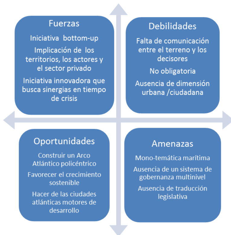
Análisis DAFO de la Estrategia Marítima Atlántica (CCAA, 2013)