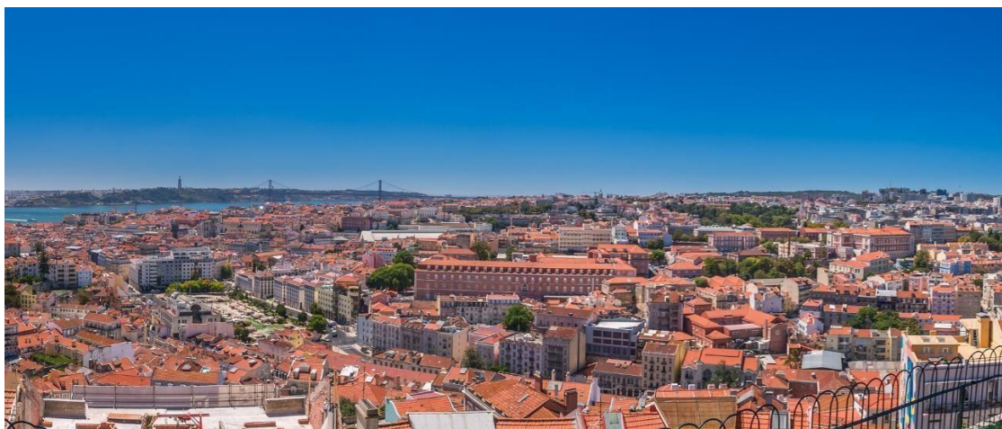
*Lisbon, Green City 2020